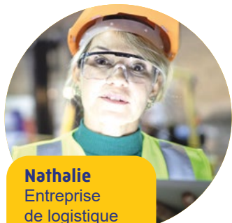
Nathalie Entreprise de logistique dans la Nièvre - 42 salariés

“ J'envisageais d'investir dans du matériel pour réduire la pénibilité des activités de mes salariés. Grâce à mon cabinet comptable, j'ai su que la Carsat Bourgogne-Franche-Comté pouvait m'aider financièrement à investir dans une nouvelle machine. Mon fournisseur m'a proposé un matériel conforme au cahier des charges de l'aide : l'investissement était de 15 000 €. Après l'achat, la Carsat a pris en charge 6 000 € comme indiqué dans les conditions d'attribution de l'aide. Cela représente un soutien non négligeable pour une petite entreprise comme la mienne ! ”