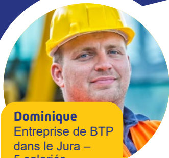
Dominique Entreprise de BTP dans le Jura – 5 salariés

“ J'envisageais d'investir dans du matériel pour réduire la pénibilité des activités de mes salariés. Grâce à mon cabinet comptable, j'ai su que la Carsat Bourgogne-Franche-Comté pouvait m'aider financièrement à investir dans une nouvelle machine. Mon fournisseur m'a proposé un matériel conforme au cahier des charges de l'aide : l'investissement était de 15 000 €. Après l'achat, la Carsat a pris en charge 6 000 € comme indiqué dans les conditions d'attribution de l'aide. Cela représente un soutien non négligeable pour une petite entreprise comme la mienne ! ”